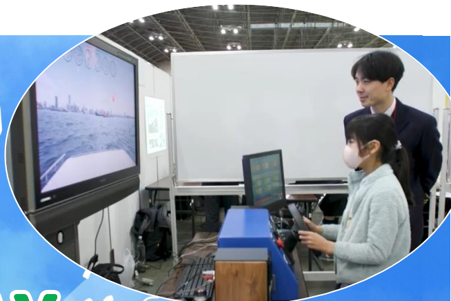
シミュレーターによる操船体験