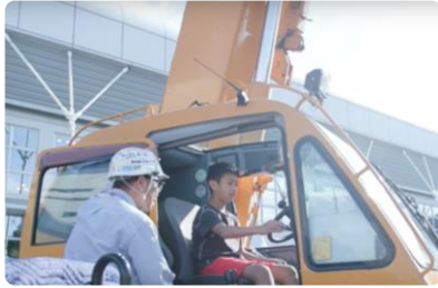
大型クレーン乗車体験